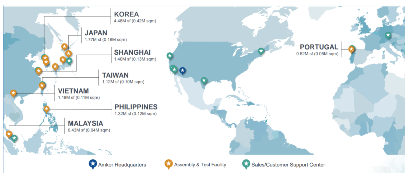
Figura 1 – Presença geográfica da Amkor

O grupo Amkor Technology foi fundado em 1968, tem atualmente cerca de 30.000 colaboradores e integra unidades industriais e de suporte em 12 países. A Amkor Technology Portugal é uma das unidades industriais.